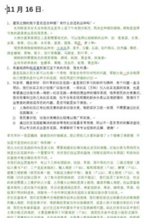
部分问答汇总文稿