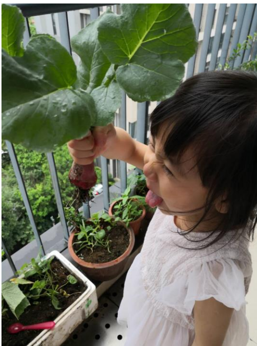
居民在自家阳台种的花草