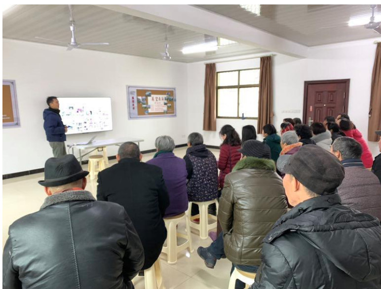
导师现场指导宣讲

第二批学员的花园在陆续建设中。其中部分学员来自公益组织，在社区中推广社区花园遇到技术瓶颈，联合居民一起加入萌芽计划习得技能、交流经验。